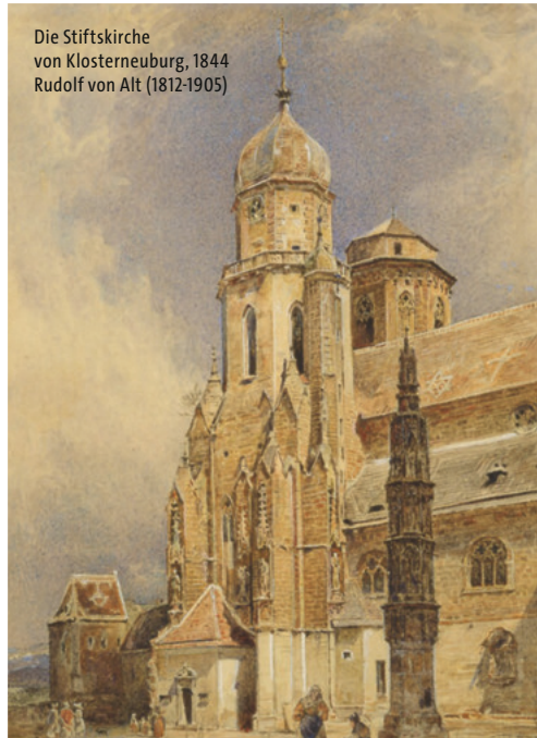
Die Stiftskirche von Klosterneuburg, 1844 Rudolf von Alt (1812-1905)